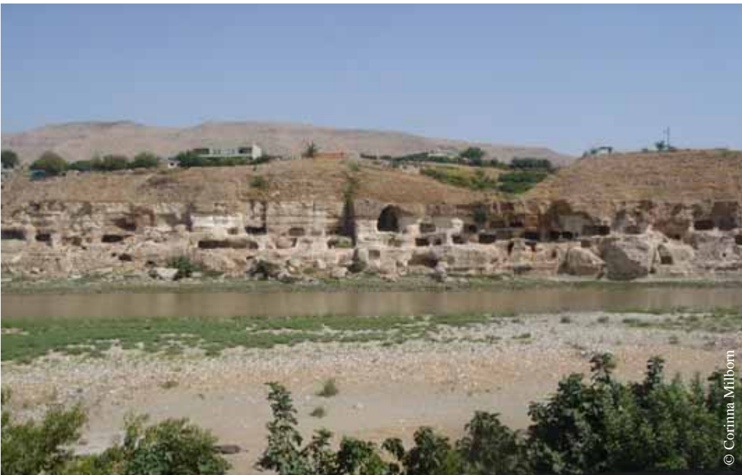
:Höhlen bei Hasankeyf – die Berghänge im Hintergrund wurden bei Kämpfen abgebrannt