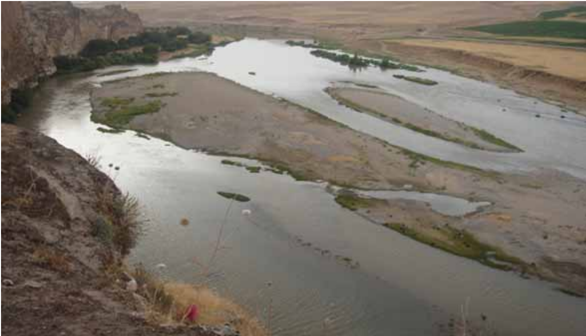
Schotterinseln als Brutplatz gefährdeter Vogelarten

Der vom Staudamm betroffene Abschnitt des Tigris ist mit seinen Schotterinseln, Schluchten und Auen eine noch weitgehend unberührte und intakte Flusslandschaft. Insbesondere nach dem fast vollständigen Einstau des benachbarten Euphrat, kommt dem Tigris für seine Bewohner eine besondere Bedeutung zu.