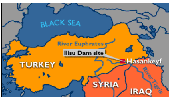
Lage des geplanten Staudammes