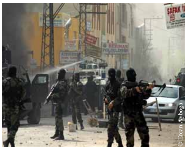
Eskalation von Gewalt in der Ilisu Projektregion Ende März 2006, Foto: Kiziltepe 29. März 2006