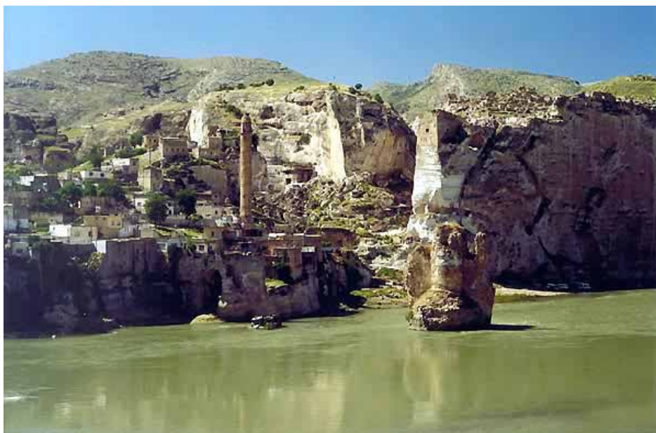
Das 11.000 Jahre alte Hasankeyf würde bis zur Spitze des Minaretts überflutet

Menschen leben, würden überflutet werden. So würde aus einer lebendigen Stadt ein künstliches Museum werden.