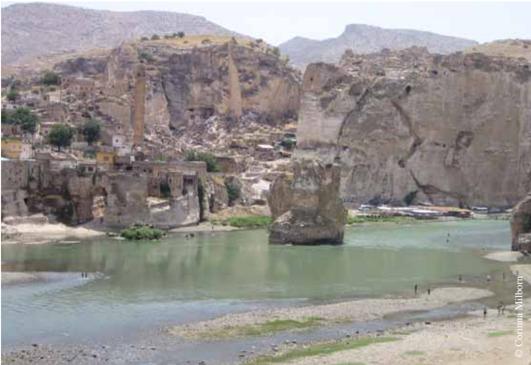
Historische Zeugnisse: Hasankeyf am Tigris