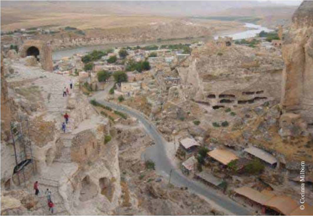
Aus dem seit 11.000 Jahren besiedelten Ort sollen alle Menschen vertrieben werden.