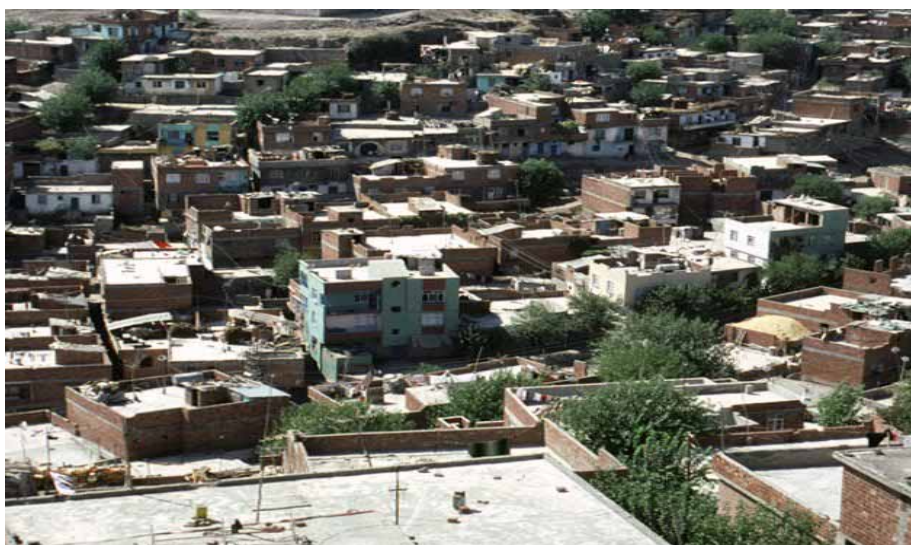
Diyarbakir ist in den letzten 15 Jahren von 370.000 auf 1,2 Mio Einwohner gewachsen.

80% der Menschen würden in die umliegenden Großstädte - vor allem nach Diyarbakir und Batman – vertrieben werden. Diese Städte sind durch bereits in den 90er Jahren durch den Zuzug von Flüchtlingen explodiert und können den Vertriebenen weder eine ausreichende Infrastruktur noch genügend Arbeit bieten. Eine weitere Verarmung droht.